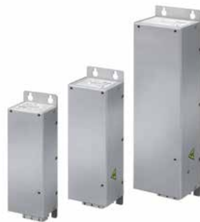
Типоразмеры 3 различных типоразмера линейных фильтров соответствуют исполнениям M1, M2 и M3 VLT® Micro Drive.